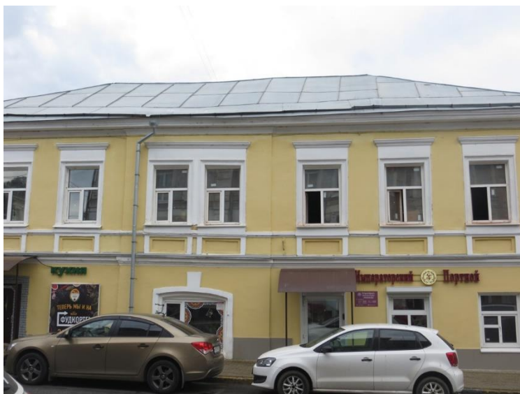
Рис. 4. Ю.М. Мессинг Рис. 5. Современный вид бывшего дома Климовых